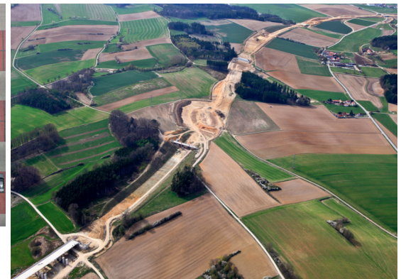
Baustelle B 15 neu