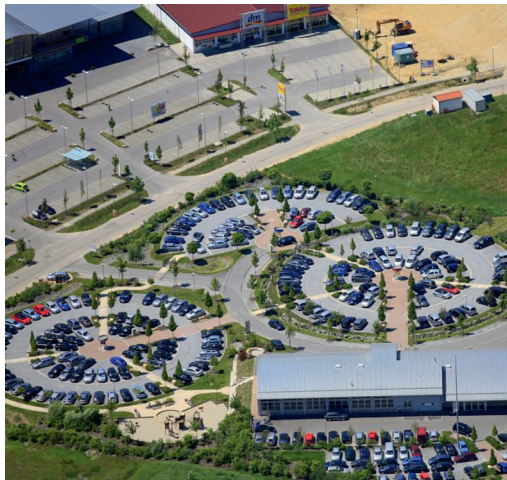
Discounterparkplatz bei Vilsbiburg

Für die Entwicklung von Wirtschaft und Infrastruktur werden immer mehr Flächen benötigt. Aber die Fläche ist begrenzt und kann nicht vermehrt werden!