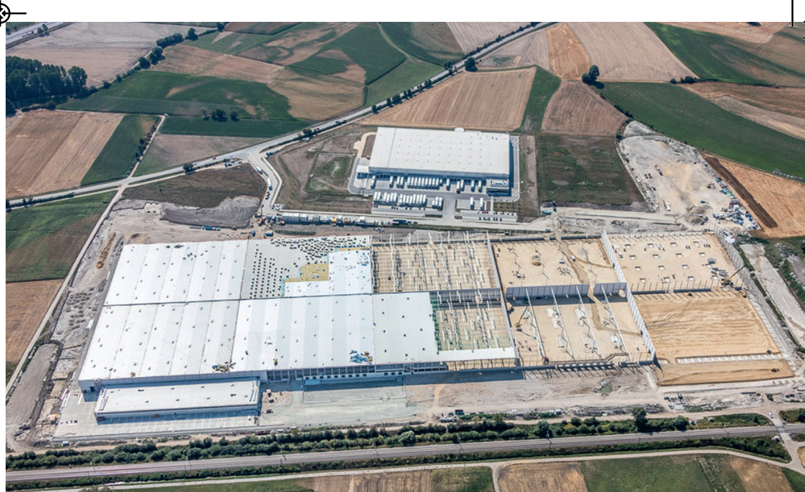
Lagerhalle BMW bei Bruckberg

Für die Entwicklung von Wirtschaft und Infrastruktur werden immer mehr Flächen benötigt. Aber die Fläche ist begrenzt und kann nicht vermehrt werden!