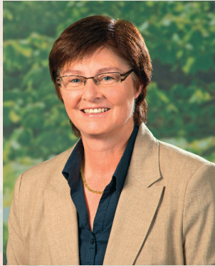
Rosi Steinberger Landtagsabgeordnete und Kreisrätin im Landkreis Landshut

V.i.S.d.P.: Rosi Steinberger, Regierungsstraße 54/5, 84028 Landshut