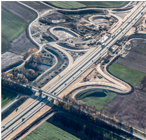
Baustelle B 15 neu bei Essenbach