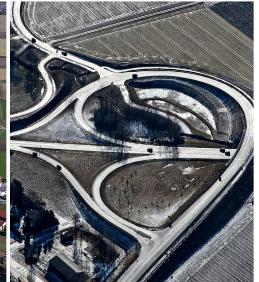
Einmündung Umgehung Vilsbiburg

2.700 Quadratmeter werden im Landkreis Landshut täglich(!)