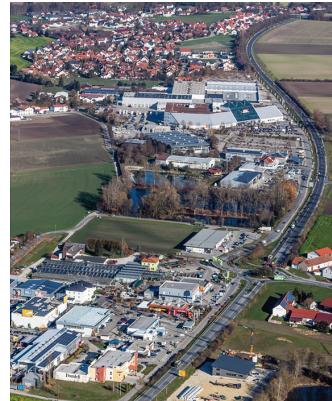
B 11 bei Weixerau